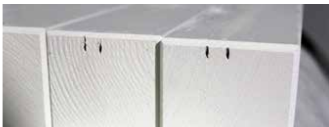
Следы от степлера.

Окрашенные изделия могут иметь следы от скоб, которыми к изделию крепились этикетки степлером перед покраской. Для покраски со всех четырех сторон изделия подвешиваются на крючки. Из-за этого наши изделия имеют небольшие отверстия для крючков.