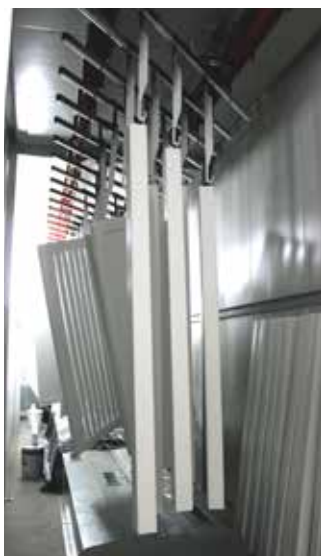
Окрашенные изделия в сушильной камере

Palmako AS применяет современные технологии покраски методом обливания и пульверизационной покраски в камере. Это позволяет окрашивать садовую продукцию меньших размеров, такую как панели ограждения, столбы и мебель, в белый и серый цвета. Влажность в камере контролируется системой увлажнения, поддерживающей необходимую среду для покраски. Окрашенные изделия сушатся в 30-метровой сушильной камере, при этом весь процесс сушки можно регулировать и контролировать. После покраски и сушки изделия упаковываются в термоусадочную пленку. Это защищает нашу продукцию от наружных повреждений, вызванных пылью, грязью и влагой. Прочную термоусадочную упаковку тяжело повредить, поэтому она идеально подходит для транспортировки. Клиент получает товар в красивой упаковке в отличном состоянии.