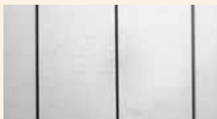
Поверхность изделия, окрашенного в белый цвет (RAL 9016).

Мы красим изделия химическим составом Rubbol Facade Special. Он образует полуматовое, эластичное, водо- и грязеотталкивающее атмосферостойкое покрытие. Состав обладает хорошей адгезией к поверхности, не имеет запаха и быстро сохнет. Мы окрашиваем изделия двумя слоями белой или серой краски, чтобы обеспечить дополнительную защиту и красивый изысканный вид.