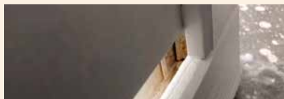
В труднодоступных местах могут остаться неокрашенные участки.

Из-за сложной формы и геометрии изделий в труднодоступных местах могут остаться неокрашенные участки. Например, краска может не проникнуть в небольшие отверстия для подвесных крючков. Из-за температуры и влажности в материале могут произойти изменения, способные повлиять на окрашенную поверхность. В случае выделения смолы это будет заметно сквозь краску и на окрашенной поверхности могут образоваться трещины. Ниже приведен рекомендуемый порядок технического обслуживания. Некоторые из наших окрашенных изделий уже собраны и готовы к использованию. В таких изделиях стыки покрывают краской для более плотного соединения при сборке. После сборки окрашенные изделия пригодны для использования на открытом воздухе при различных погодных условиях, такие как ветер, дождь, солнце и пр. Допускаются небольшие цветовые различия окрашенных изделий.