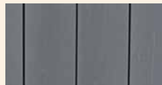
Поверхность изделия, окрашенного в серый цвет (RAL 7016).