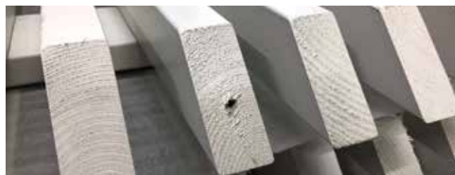
Небольшие отверстия для подвесных крючков.