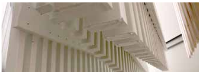
Капли краски на изделиях.

При покраске излишки краски собираются в капли, видимые на всех окрашенных изделиях с нижней стороны. Их можно аккуратно счистить ножом.