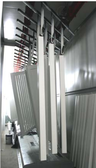
Productos pintados en cámara de secado

Palmako AS ha invertido en tecnología de pintado moderna, lo que nos permite pintar productos para jardín de pequeño tamaño, como paneles de cercas, postes y muebles. Hoy podemos pintar productos de blanco y gris usando el método de aplicación por aspersión y cámara de rociado. La humedad del cuarto de pintura se controla con un sistema de humidificación, cuyo objetivo es lograr el entorno adecuado para pintar. Después de pintarlos, los productos se llevan a una cámara de secado de 30 metros de longitud, donde todo el proceso de secado puede ser ajustado y observado.