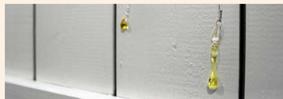
La resina se puede desprender.

Ninguna de las peculiaridades mencionadas en este documento (marcas de pistolas de grapas, pequeños agujeros de ganchos de colgar, gotas de pintura, nudos, irregularidades de la madera, rincones difíciles no pintados, resina a través de la pintura y grietas, pintura en ranuras, pequeñas diferencias de color) es motivo de reclamaciones.