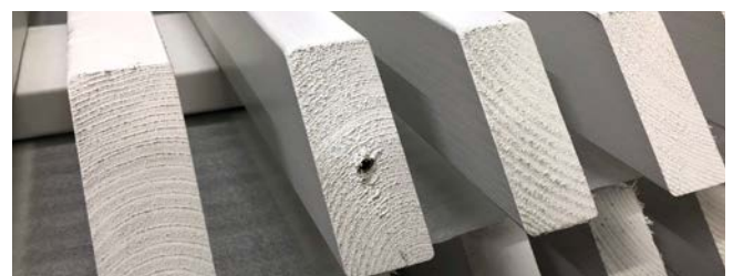
Pequeños agujeros hechos para los ganchos de colgar.