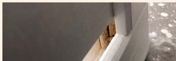
La pintura no llega a todas partes.

Se permiten diferencias de color a pequeña escala en los productos pintados.