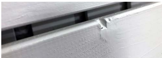
Nudos de la superficie.

Dado que la superficie de la madera está estampada, la pintura resalta las irregularidades de la madera. Uno de los defectos más comunes de la madera son los nudos, los que son más visibles después de pintar.