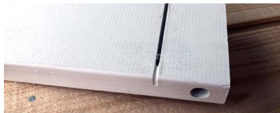
Pinte en la ranura de un elemento.