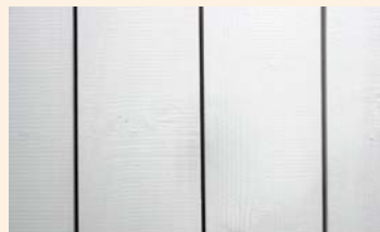
Superficie de un producto pintado de blanco (RAL 9016).

Pintamos nuestros productos con el producto químico Rubbol Facade Special. Éste crea una película semimate, elástica, impermeable, repelente de polvo y resistente a la intemperie. Tiene buena adherencia a la superficie, tiene poco olor y se seca rápidamente. Pintamos nuestros productos con dos capas de pintura blanca o gris para dar una protección adicional y un aspecto elegante y agradable.