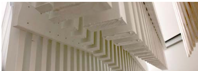
Gotas de pintura en los productos.

Después de pintar, el exceso de pintura se desprende en gotas; estas gotas se ven en la parte inferior de todos los productos pintados. Se pueden quitar suavemente con la ayuda de un cuchillo.