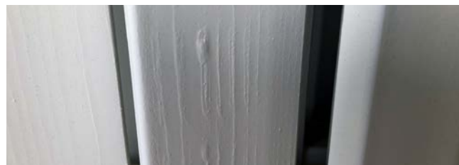
Desigualdad de la madera.

Debido a la complejidad, los ángulos y las múltiples facetas de nuestros productos, existe la posibilidad de que la pintura no llegue a todas partes. Por ejemplo, la pintura no puede llegar a los pequeños orificios de los ganchos de colgar. Debido a la temperatura y la humedad, pueden ocurrir cambios en el material que pueden afectar la superficie pintada. Puede ocurrir liberación de resina visible a través de la pintura y de grietas en la superficie pintada. Para el mantenimiento, siga las acciones recomendadas a continuación. Algunos de nuestros productos pintados ya están ensamblados y listos para usar.