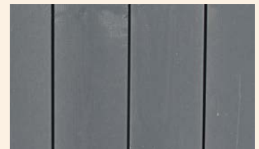
Superficie de un producto pintado de gris (RAL 7016).