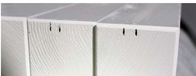
Marcas de pistola de grapas.

Debido a estos ganchos, nuestros productos tienen agujeros pequeños en la superficie.