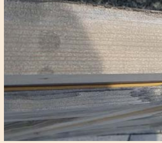
Upotusliuos ei pääse kaikkialle