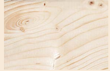
WTDIP Valkoinen liuos