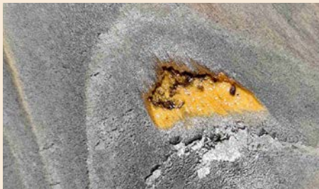
Puu voi erittää pihkaa