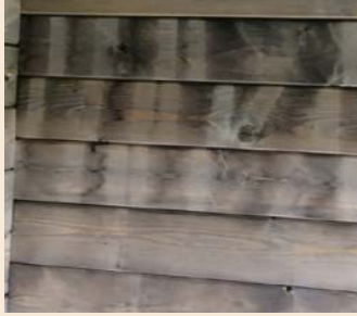
Tukipuiden aiheuttamia sävyeroja