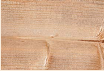
BNDIP Ruskea liuos