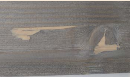
Täyteaineella viimeistely kohta upotuskäsitellyssä puussa

Lämpötila ja kosteus saattavat aiheuttaa puussa muutoksia, jotka vaikuttavat upotuskäsittelyyn pintaan. Pinta voi alkaa erittää pihkaa. Pihka tulisi poistaa varovasti harjalla tai hiekkapaperilla, minkä jälkeen pinta maalataan uudelleen.