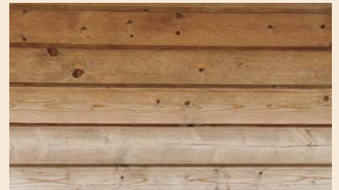
Pelkällä ruskealla upotusliuoksella käsitellyn piharakennuksen seinä neljä vuotta käsittelyn jälkeen. Auringonvalolle altistuneet pinnat ovat haalistuneet selvästi.

Kaikki upotuskäsitellyt tuotteet ovat alttiita auringonvalon vaikutuksille. Harmaalla tai ruskealla upotusliuoksella käsiteltyjen tuotteiden väri alkaa muuttua pian sen jälkeen, kun ne altistetaan auringonvalolle. Vuosien saatossa väri taittuu ensin pronssiin ja haalistuu sitten harmaaksi. Varjossa olevat kohdat säilyttävät alkuperäisen värinsä. Haalistumisen nopeus riippuu sääoloista ja auringonvalon voimakkuudesta.