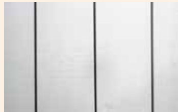
Overflate av et hvitmalt (RAL 9016) produkt.

Vi maler våre produkter med Rubbol Facade Flow. Den gir et halvmatt, elastisk, vann- og smussavvisende værbestandig filmsjikt. Den har god vedheft til overflaten, avgir lite lukt og tørker raskt. Vi maler våre produkter med to strøk hvit eller grå maling etter grunning for å gi ekstra beskyttelse og et pent og elegant utseende.