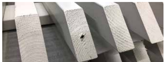
Små merker / hull forårsaket av hengekroker.