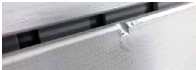
Kvister på overflaten.

Siden trevirkets overflate har struktur, vil maleprosessen kunne synliggjøre ujevnheter og strukturer i trevirket. En av de vanligste ujevnhetene i trevirke er kvister, som kan bli mer synlige etter maling.