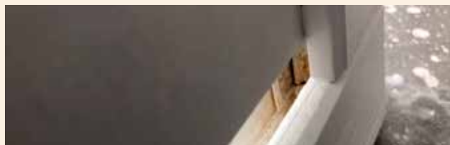
Malingen kan i blant ikke dekke alle kriker og kroker.

På grunn av at våre produkter er komplekse, kantete og har mange sider, kan det hende at malingen ikke kommer til i hver eneste krik og krok. Malingen kan for eksempel ikke alltid dekke så merker og hull, som er forårsaket av hengekroker. Det kan forekomme endringer i trevirket på grunn av temperatur og fuktighet, som kan påvirke den malte overflaten. I tillegg kan det være utslipp av harpiks, som blir synlig gjennom malingen, og det kan oppstå sprekker i den malte overflaten. Følg anbefalingene nedenfor for vedlikehold. Noen av våre malte produkter er allerede ferdig monterte og klare til bruk. Andre produkter trenger montering, for eksempel blomsterkasser. På disse produkter har maling også dekket delenes kanter, slik at montering kan gjøre sammenføyningene trangere. Etter montering og bruk av de malte produktene, vil de utsettes for forskjellige værforhold som vind, regn, sol osv. Mindre fargeforskjeller på malte produkter er tillatt.