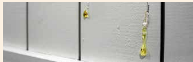
Harpiksutslipp kan forekomme.

Alle særegenheter nevnt i dette dokumentet (merker etter stiftepistol, små hull forårsaket av hengekroker, malingsdråper, kvister på overflaten, ujevnheter i trevirke, maling som ikke dekker alle kriker og kroker harpiks som kommer til syne gjennom malingen og sprekker, maling i monteringsspor, mindre fargeforskjeller) gir ikke grunnlag til reklamasjoner.