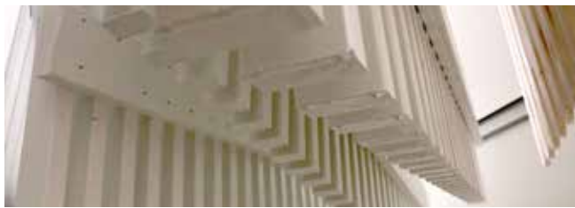
Malingsdråper på produkter.

I maleprosessen kan overflødig maling samle seg i dråper. Disse dråpene vil i så fall være synlige på av produktet. Disse kan fjernes forsiktig med hjelp av en skarp kniv.