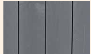
Overflate av et grått (RAL 7016) malt produkt.