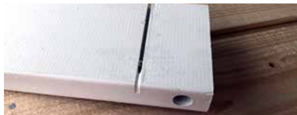
Färg i en räffla på en detalj.

Besiktning och underhåll rekommenderas en gång per år samt övermålning vid behov. För vitmålade produkter, använd vattenbaserad färg med färgkod RAL 9016, för gråmålade produkter färgkod RAL 7016. Förvaras torrt utomhus, undan från direkt solljus. Förvaras inte inomhus vid varma förhållanden.