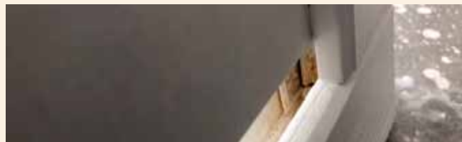
Färg kan inte nå in i varje litet hörn.

Färgskiftningar i mindre omfattning för målade produkter är tillåtet.