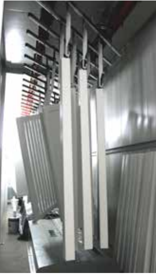
Målade produkter i torkkammare

Vi har investerat i modern teknik för färgbehandling av mindre trädgårdsprodukter såsom staketpaneler, stolpar och möbler. För närvarande kan vi måla våra produkter vita och grå. Det görs i en sprutkammare med modern flow-coating teknik. Fukthalten i sprutkammaren kontrolleras av ett befuktningssystem som säkerställer exakt rätta förhållanden för målning. Efter målning torkas detaljerna i en 30 m lång torkkammare som garanterar full kontroll över torkprocessen.