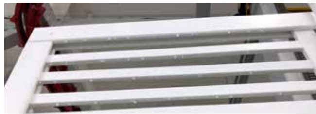
Färgdroppar på produkter.

Eftersom träytan är ådrig jämnar färg ut ojämnheter för träet. En av de vanligaste defekterna på trä är kvistar som syns tydligare efter målning.