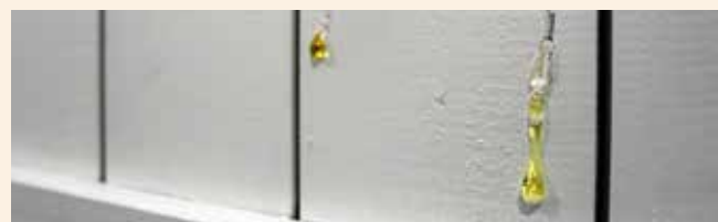
Kåda kan frigöras.

Alla egenheter som omnämns i detta dokument (märken från häftklammer, små håll orsakade av upphängningskrokar, färgdroppar, kvistar på ytan, ojämnheter i träet, färg som inte nått in i hörn, kåda som tränger igenom färgen och sprickor, färg i räfflor, mindre färgskiftningar) är inte orsak till reklamation.