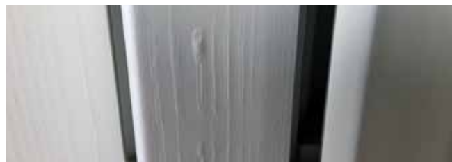
Ojämnheter på trä.

På grund av våra produkters komplexitet, vinkelformer och flersidighet finns det en möjlighet att färg inte når in i varje litet hörn. Till exempel når inte färgen de små håll som orsakas av upphängningskrokarna. På grund av temperatur och fukt kan vissa förändringar uppstå i materialet vilket kan påverka den målade ytan. Kåda kan frigöras och bli synlig genom färgen och sprickor i den målade ytan kan komma fram. Följ de rekommenderade åtgärderna nedan för korrekt underhåll.