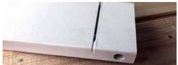
Lähikuva urassa olevasta maalista.

Tuote kannattaa tarkistaa ja huoltaa vuosittain ja maalata uudelleen tarpeen mukaan. Valkoiseksi maalatuille tuotteille käytä vesiliukoista maalia, jonka värikoodi on RAL 9016, ja harmaaksi maalatuille tuotteille maalia, jonka värikoodi on RAL 7016. Varastoi ulos kuivaan paikkaan pois suorasta auringonvalosta. Älä säilytä tuotetta sisällä lämpimässä.