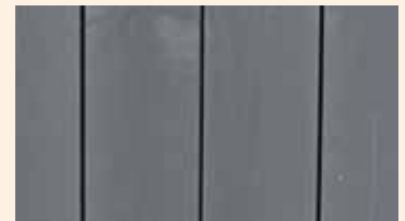
Harmaaksi (RAL 7016) maalatun tuotteen pinta.