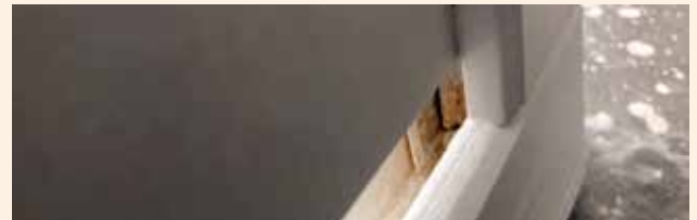
Maali ei yllä ihan jokaiseen nurkkaan.

Koska tuotteemme ovat monimutkaisia ja niissä on paljon sivuja ja kulmia, on mahdollista, ettei maali yllä ihan jokaiseen nurkkaan. Maali ei esimerkiksi mene ripustuskoukkujen jättämiin pieniin reikiin. Materiaali voi altistua lämpötilan tai kosteuden vaihtelulle, mikä näkyy maalatussa pinnassa. Puu voi erittää pihkaa, joka näkyy maalin läpi, ja maalattuun pintaan saattaa syntyä halkeamia. Pinnan hoitamisessa suosittelemme noudattamaan alla annettuja ohjeita. Jotkut maalatuista tuotteistamme on koottu valmiiksi, ja ne ovat käyttövalmiita. Toiset tuotteet, kuten piknik-pöydät, pitää koota. Tällaisissa tuotteissa myös liitoskohdissa on maalia, jolloin niiden kokoaminen voi olla vaikeampaa. Kokoamisen jälkeen maalatut tuotteet voidaan jättää ulos alttiiksi tuulelle, sateelle, auringolle ja muille sääoloille. Maalatuissa tuotteissa esiintyvät pienet väripoikkeamat ovat mahdollisia.