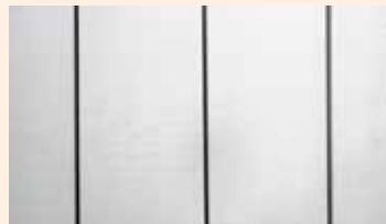
Valkoiseksi (RAL 9016) maalatun tuotteen pinta.

Parhaan suojauksen varmistamiseksi ja tuotteiden elegantin ulkonäön takaamiseksi ne maalataan kahteen kertaan valkoisella tai harmaalla maalilla.