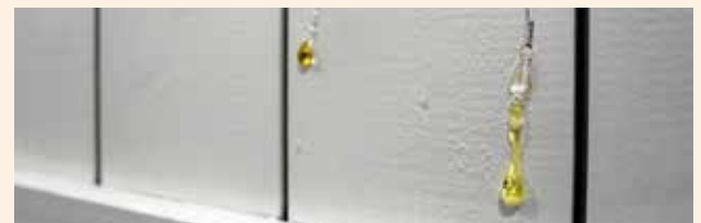
Puu voi erittää pihkaa.

Mitään tässä asiakirjassa mainituista poikkeamista (niittien jättämät jäljet, ripustuskoukkujen aiheuttamat pienet reiät, maalipisarot, oksakohdat, puupinnan epätasaisuus, maalaamattomat nurkat, puun erittämä pihka, maalipinnan halkeamat, urissa oleva maali, pienet väripoikkeamat) ei katsota reklamaatioperusteeksi.